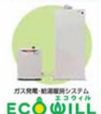
ガス発電・給湯暖房システム エコウィル ECO-WILL