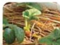
①ワラをひいて防寒

良く日が当たり、強い寒風が当たらない場所で育てます。10℃～25℃が適温ですが、寒さには強いので凍りさえしなければ越冬できますが、寒くなってきた根元にワラなどをのせて防寒対策をしましょう。（写真①）水、肥料のやりすぎは良くありませんが、表面の土が乾いてきたら、水をたっぷりあげます。伸びてきたランナーや枯れ葉を取り除くと病気にかかりにくくなります。