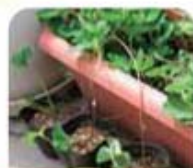
②収穫後伸びてきたランナーから小株分け

新しいワラに取り替えるとドロはねが少なく、きれいな実を収穫できます。開花したら受粉がうまくいくよう、雨に濡れないようにします。屋外で育てる場合、ラックやスタンドの上におくと、ナメクジやアリの被害が少なくなります。