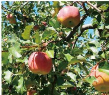
▲高さ3mくらいに仕立てた矮生台樹と、自然のままに育てた普通樹があります。こちらは普通樹。