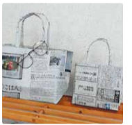
※写真はイメージです 当日は英字新聞を使います

古新聞や包装紙でつくる人気のエコバッグ! ちょっとしたプレゼント もおしゃれに変身! お野菜の保管、ちょっとしたお買いものなど 何かと使える便利なアイテムですよ★